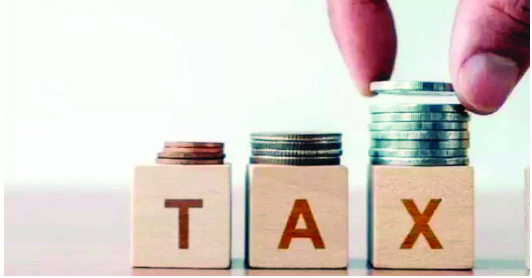
ఆర్థిక సంవత్సరం (2025-26) సవరించిన అంచనాలలో కోట్లుగా అంచనా వేసింది. ప్రభుత్వం ప్రత్యక్ష పన్ను వసూళ్లను రూ.24.84 లక్షల

ప్రస్తుత ఆర్థిక సంవత్సరంలో నికర ప్రత్యక్ష పన్ను వసూళ్లు ఫిబ్రవరి 10 నాటికి రూ. 19.43 లక్షల కోట్లకు పైగా వసూలైనట్లు ఆదాయ పన్ను విభాగం బుధవారం తెలిపింది. గతేడాది ఇదే కాలంతో పోలిస్తే ఇవి 9.4 శాతం వృద్ధి చెందాయి. ప్రస్తుత ఆర్థిక సంవత్సరంలో ఎక్కువ మంది పన్నులు సరిగ్గా చెల్లించడంతో పాటు వ్యాపార కార్యకలాపాలు పెరగడం వల్లనే ఈ పెరుగుదలకు ప్రధాన కారణమని ఆదాయ పన్ను విభాగం పేర్కొంది. ఆదాయపు పన్ను శాఖ బుధవారం విడుదల చేసిన డేటా ప్రకారం.. నికర కార్పొరేట్ పన్ను వసూళ్లు 14.51 శాతం పెరిగి రూ. 8.90 లక్షల కోట్లకు చేరుకోగా, వ్యక్తులు, హిందూ అవిభక్త కుటుంబాలు (హిందూయాఎఫ్ఎ) సహా కార్పొరేట్ యేతర సంస్థల నుంచి వచ్చే పన్నులు 5.91 శాతం పెరిగి రూ. 10.03 లక్షల కోట్లకు చేరుకున్నాయి. సెక్యూరిటీ లావాదేవీల పన్ను వసూళ్లు రూ. 50,279 కోట్లుగా ఉన్నాయి. ఇదే సమయంలో పన్ను రీఫండ్లు 18.82 శాతం తగ్గి రూ. 3.34 లక్షల కోట్లకు చేరుకున్నాయి. రిఫండ్ల సర్దుబాటు చేయడానికి ముందు స్కూల ప్రత్యక్ష పన్ను వసూళ్లు ఫిబ్రవరి 10 నాటికి 4.09 శాతం పెరిగి రూ. 22.78 లక్షల కోట్లుగా ఉన్నాయి. ప్రస్తుత