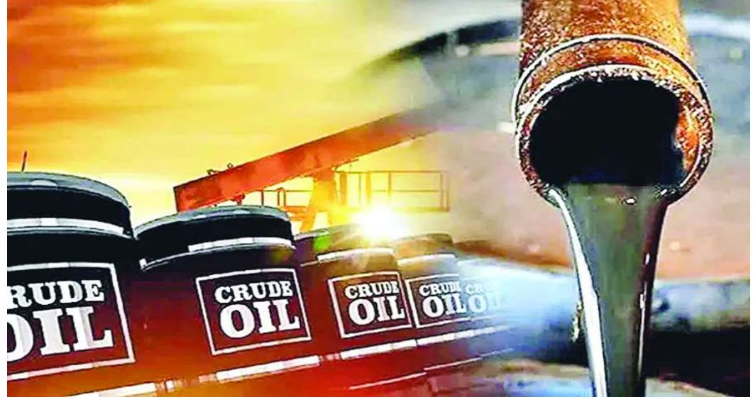
చూడాల్సింది. దీంతోపాటు చమురు రవాణా ఖర్చులూ అధికమవుతాయి. పశ్చిమ ఆఫ్రికా, కజకిస్తాన్ నుంచి అయితే ఖర్చు తగ్గుతుంది. వెనెజువెలా ముడిచమురు నిల్వలను విక్రయించడంపై అమెరికా దృష్టి పెట్టింది. మనదేశం నుంచి ఇండియన్ ఆయిల్, భారత్ పెట్రోలియం, హిందుస్థాన్ పెట్రోలియం రిఫైనరీలు ఇటీవల 4 మిలియన్ బ్యారెళ్ల వెనెజువెలా ముడిచమురును దిగుమతి చేసుకున్నాయని సమాచారం.

అమెరికా, వెనెజువెలా నుంచి ముడిచమురు కొనుగోళ్లు పెంచడాన్ని పరిశీలించాల్సిందిగా ఐ.ఓ.సి, బీపీసీఎల్, హెచ్ఐసీఎల్ వంటి ప్రభుత్వరంగ రిఫైనరీ సంస్థలను ప్రభుత్వం కోరింది. తమతో కుదిరిన వాణిజ్య ఒప్పందంలో భాగంగా రష్యా చమురు కొనుగోలు చేయడాన్ని భారత్ నిలిపి వేయనుందని అమెరికా ప్రకటించిన విషయం తెలిసిందే. ఈ నేపథ్యంలోనే, టెండర్ల ద్వారా స్పాట్ మార్కెట్ నుంచి చమురు కొనుగోలు చేసే సమయంలో అమెరికా గ్రేడ్లకు ఎక్కువ ప్రాధాన్యత ఇవ్వాలిందిగా ప్రభుత్వం కోరినట్లు రిఫైనరీ వర్గాలు తెలిపాయి. వెనెజువెలా ముడిచమురు విషయంలోనూ ప్రభుత్వం ఇటువంటి సూచన చేసినట్లు వెల్లడించాయి. రష్యా చమురు కొనుగోళ్లను నిలిపివేయడానికి భారత్ అంగీకరించినది అమెరికా అధ్యక్షుడు ట్రంప్ ప్రకటించారు. ఇంధన భద్రతకు ప్రాధాన్యమిస్తామని, దేశ అవసరాలకు అనుగుణంగా అవకాశం ఉన్న చోట కొనుగోలు చేస్తామనే మనదేశం వెల్లడించింది. అమెరికా, వెనెజువెలా చమురు కొనుగోళ్ల విషయంలో భారత్ రిఫైనరీలకు పరిమితులు ఉన్నాయి. అమెరికా చమురు గ్రేడ్లతో తక్కువ గుంధకం (సల్ఫర్) ఉంటుంది. అయితే భారత్ రిఫైనరీలు తమ యూనిట్లను మధ్యరకం చమురును శుద్ధి చేసేందుకు వీలుగా ఏర్పాటు చేశాయి. అందువల్ల అమెరికా చమురు ఎంతవరకు సరిపోతుందో